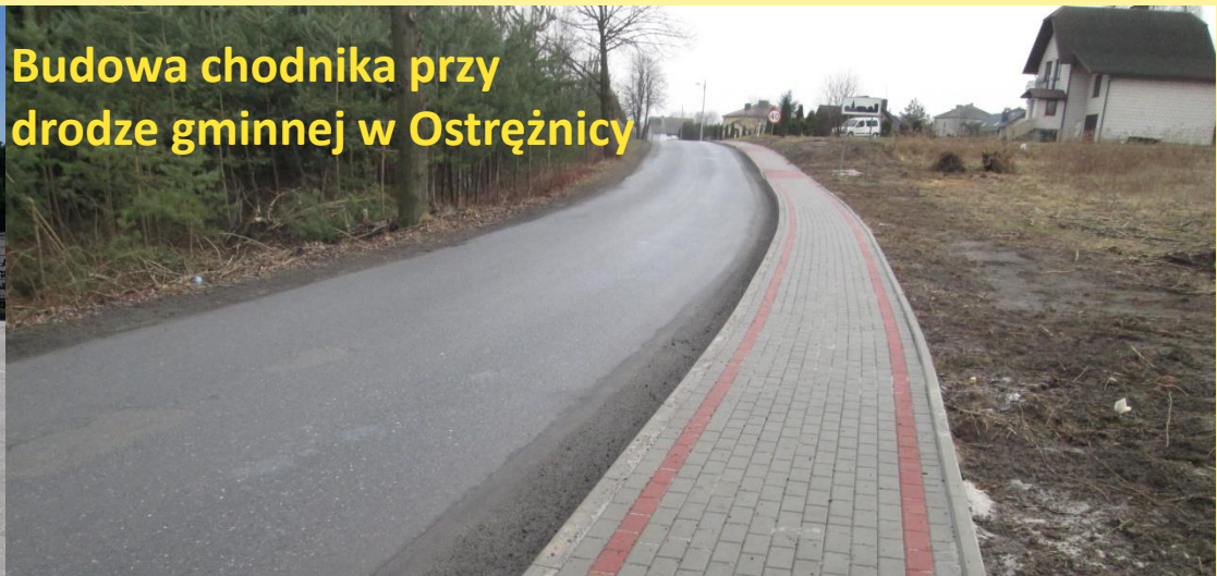
Budowa chodnika przy drodze gminnej w Ostrężnicy