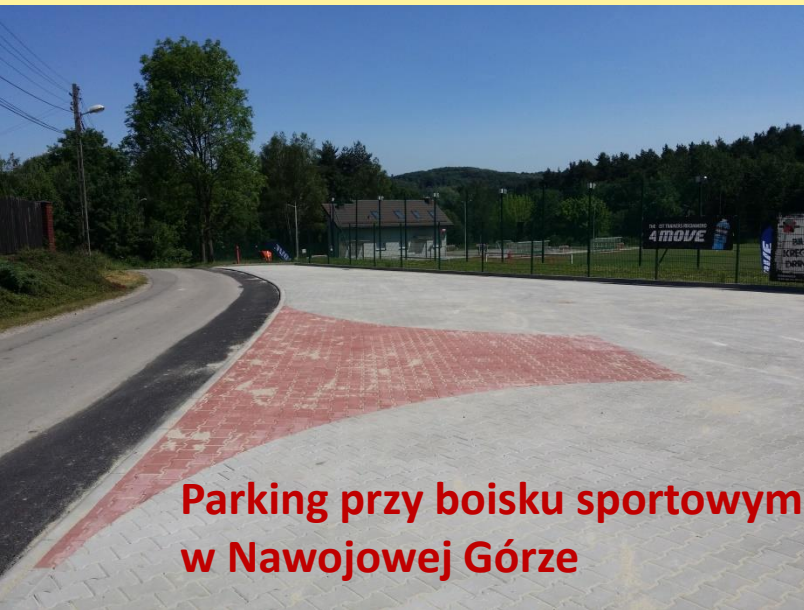
Parking przy boisku sportowym w Nawojowej Górze