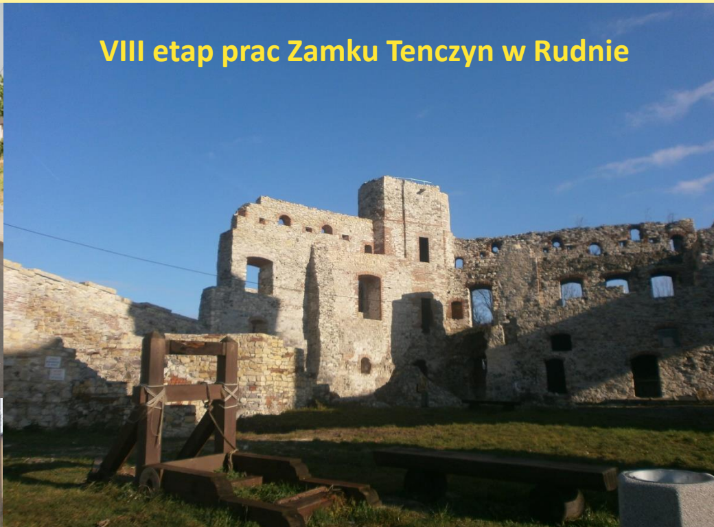
VIII etap prac Zamku Tenczyn w Rudnie