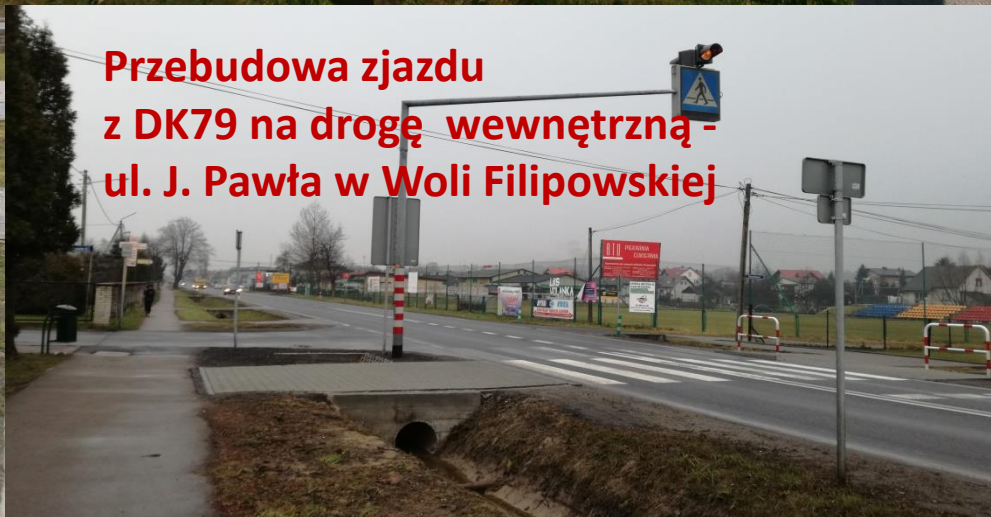
Przebudowa zjazdu z DK79 na drogę wewnętrzną - ul. J. Pawła w Woli Filipowskiej