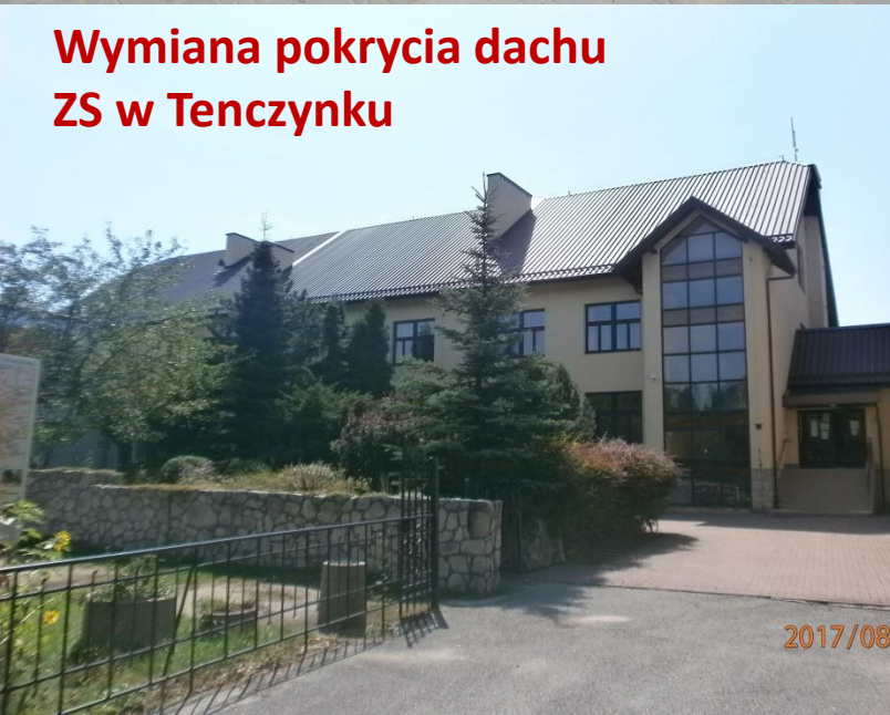
Wymiana pokrycia dachu ZS w Tenczynku