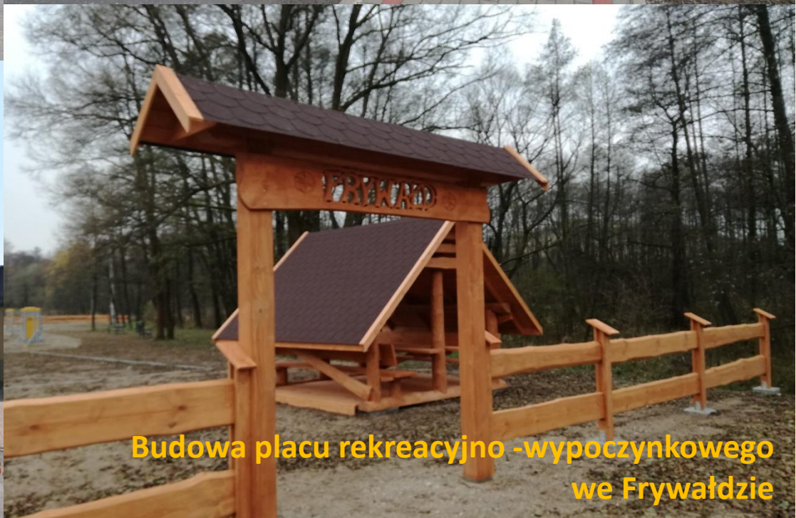
Budowa placu rekreacyjno -wypoczynkowego we Frywałdzie