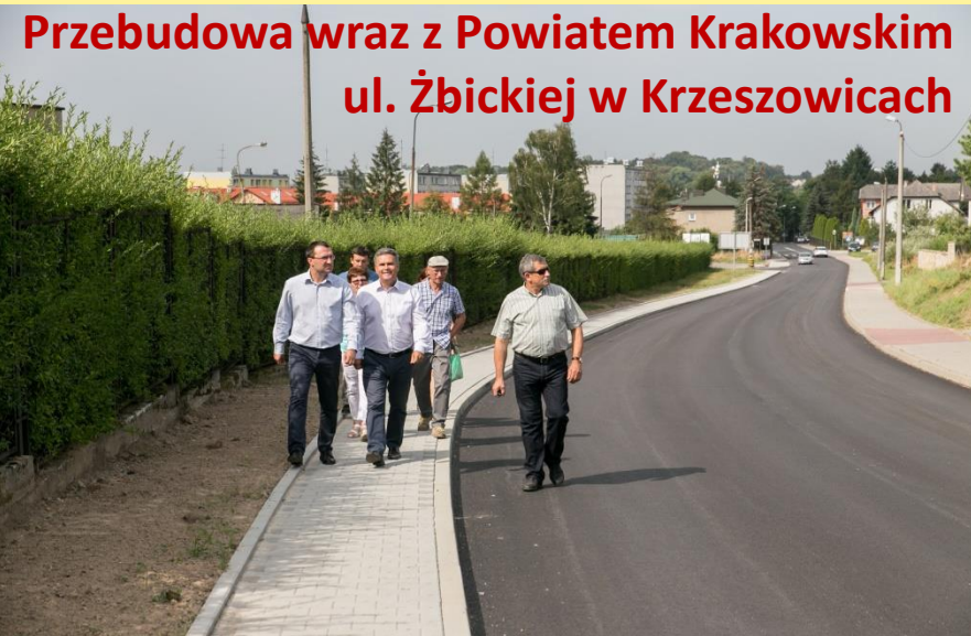
Przebudowa wraz z Powiatem Krakowskim ul. Żbickiej w Krzeszowicach