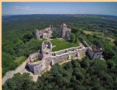
KULTURA I ZABYTKI