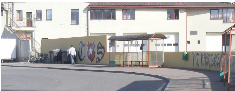
Dworzec autobusowy w Krzeszowicach przed i po remoncie

Ponadto, wychodząc naprzeciw osobom i rodzinom, które znalazły się w trudnej sytuacji materialnej i nie mają możliwości spłaty zaległości bądź mają trudności z bieżącym regulowaniem opłat, w 2016 r. opracowany został program oddłużeniowy, określający zasady umorzenia części należności pieniężnych przysługujących gminie Krzeszowice od najemców z tytułu opłat czynszowych, odszkodowań za zajmowanie lokalu bez tytułu prawnego, opłat niezależnych od właściciela, kosztów postępowania sądowego i egzekucyjnego oraz odsetek ustawowych, przyjęty uchwałą nr XXIII/233/2016 Rady Miejskiej w Krzeszowicach z dnia 4 sierpnia 2016 r.