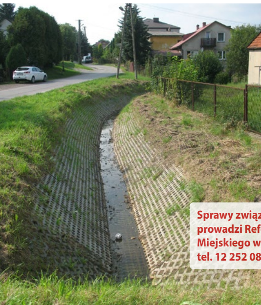
Sprawy związane z wycinką drzew i krzewów prowadzi Referat Ochrony Środowiska Urzędu Miejskiego w Krzeszowicach, ul. Grunwaldzka 4, tel. 12 252 08 13.