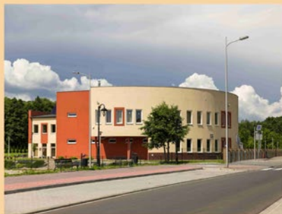
SZKOŁY I PRZEDSZKOLA